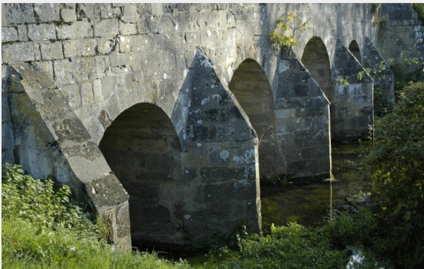
Pont Catinat

Communauté de Communes du Pays de Mortagne au Perche - Mauves-sur-Huisne