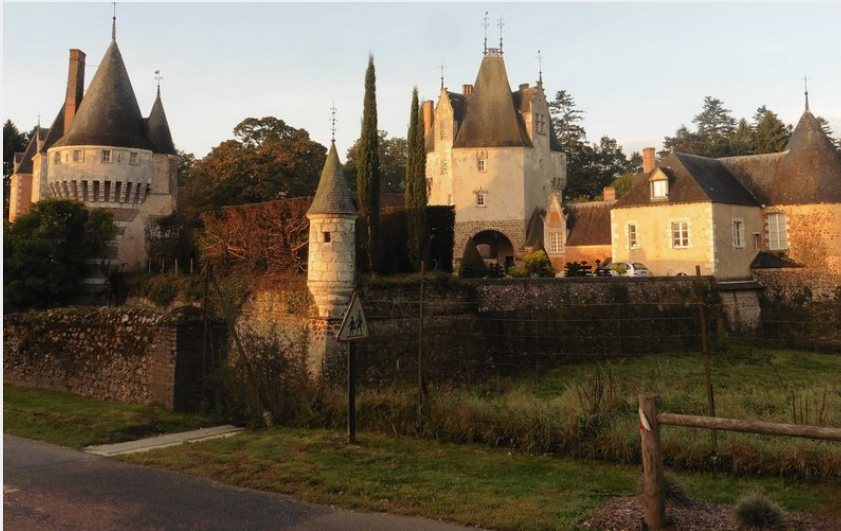
Château de Frazé