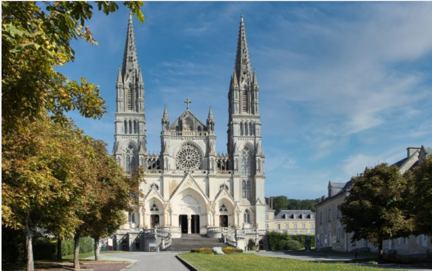
Basilique Notre-Dame de Montligeon (Didier Orsal)