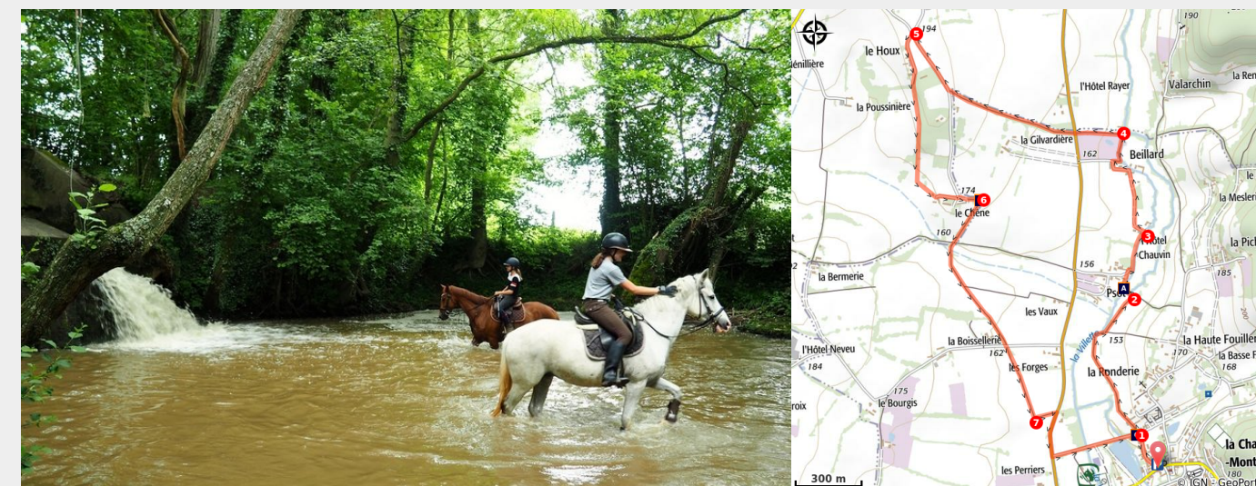
Chute d'eau de Beillard (admin-pnpr)

Situés à la lisière de la forêt de Réno-Valdieu, les villages voisins de Saint-Mard-de-Réno et de La Chapelle-Montligeon, dont le passé est étroitement lié à ce massif forestier depuis les origines médiévales proposent ensemble ce circuit qui pourra vous mener d'un village à l'autre.