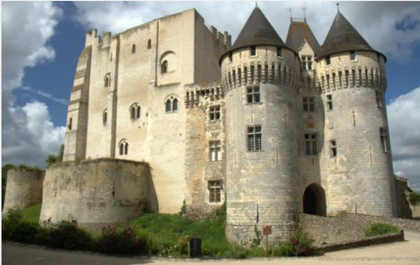
Château des comtes de Rotrou