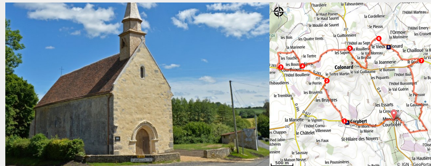
Chapelle de Courthioust (O.Steigel)

Les Trois Clochers sont ceux de l'église Saint Pierre à Corubert, Notre-Dame à Courthioust et Saint Joseph Saint Martin dans le bourg de Colonard. Trois églises que cette balade relie entre elles par des chemins creux offrant de multiples points de vue sur le bocage percheron.