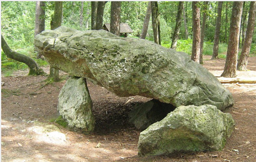
La Pierre Procureuse (OT Mortagne-au-Perche)